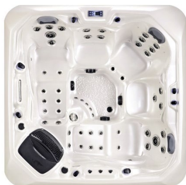
W04 - Perlweiss