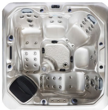
W21 - Silber marmoriert