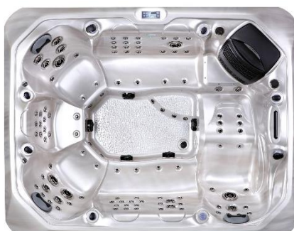
W21 – Silber marmoriert