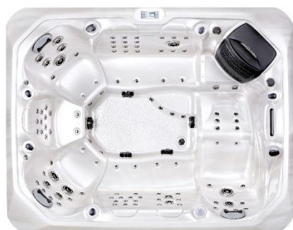
WO4 - Perlweiss